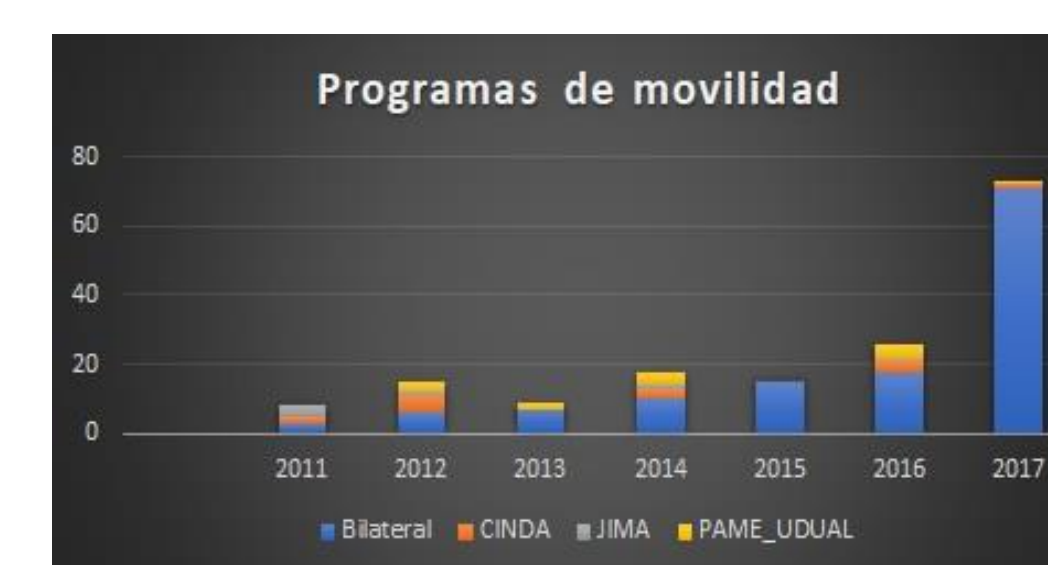
Figura 5. Programas de movilidad elegidos por los estudiantes extranjeros.

Los programas de movilidad utilizados por los estudiantes son: Programa Bilateral; Programa Académico de Movilidad Educativa-Unión de Universidades de América Latina y El Caribe (PAME_UDUAL); Programa de Intercambio Universitario- Centro Interuniversitario de Desarrollo (CINDA) y Programa Jóvenes de Intercambio México-Argentina (JIMA).