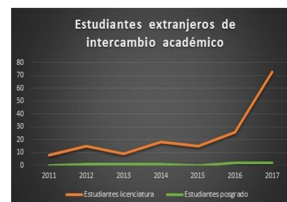
Figura 1. Estudiantes extranjeros de intercambio académico.

Este comportamiento indica que la Universidad tiene mayor presencia en los diversos programas de movilidad y en consecuencia una colaboración más estrecha con otras Instituciones de Educación Superior.