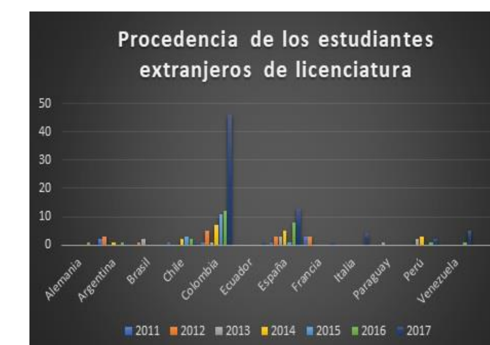
Figura 2. Procedencia de los estudiantes extranjeros de licenciatura.

El lugar de procedencia de los estudiantes extranjeros que llegan a realizar estancia educativa a nivel licenciatura incluye tanto países Latinoamericanos como de la Unión Europea. La cantidad de estudiantes extranjeros que vienen a realizar estudios de posgrado es menor pues ha sido únicamente de uno o dos por año. El intercambio varía dependiendo de las diversas áreas de estudio.