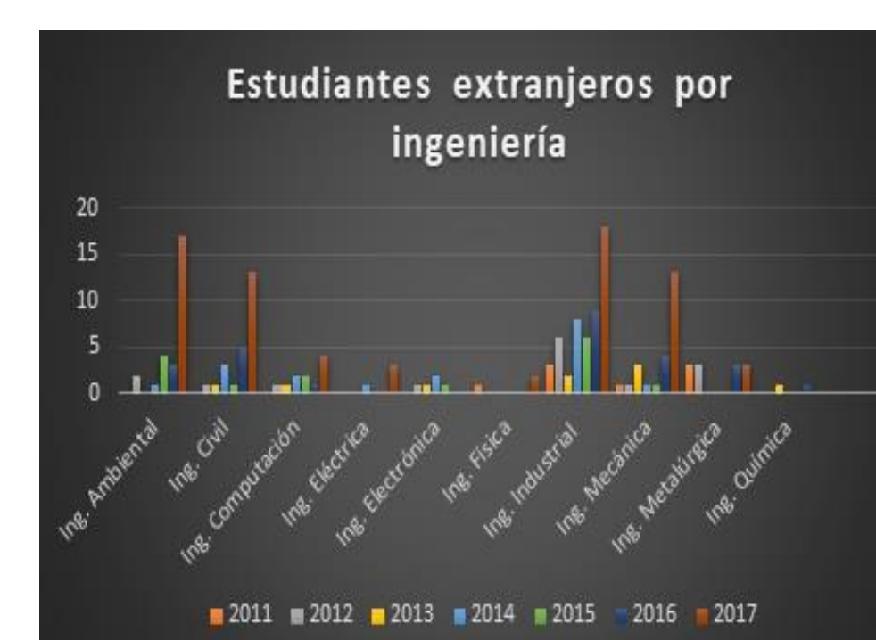
Figura 4. Distribución de estudiantes extranjeros por ingeniería.

La selección de los estudiantes extranjeros de nivel posgrado abarca la Maestría en Ciencias e Ingeniería Ambiental, la Maestría en Ciencias e Ingeniería de Materiales y la Maestría y Doctorado en Ingeniería de Procesos. Como puede observarse es insuficiente el número de estudiantes extranjeros que deciden realizar sus estudios de posgrado en la Universidad. Esto puede explicarse por diversas razones: a) porque los estudiantes prefieren realizar dichos estudios en universidades con un mejor ranking a nivel internacional, b) la existencia de un intercambio permanente de estudiantes extranjeros en Instituciones de Educación Privadas, c) lo atractivo que resultan los programas y planes de estudio institucionales, d) la cantidad de convenios con los que cuenta cada Institución de Educación Superior, etc.